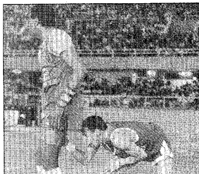
Los Harlem provocaron risas.

Mañana domingo, a las 9.30, se celebrará una tirada de pistola standard, en el mismo polígono.