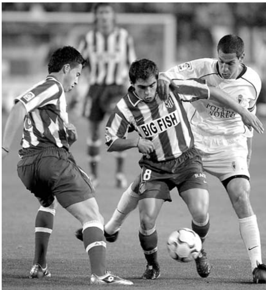
ENTRADA. Acciari intenta frenar a Ibagaza, que avanza con la pelota.

► Nano, en el minuto 96, empataba para el Atlético de Madrid.