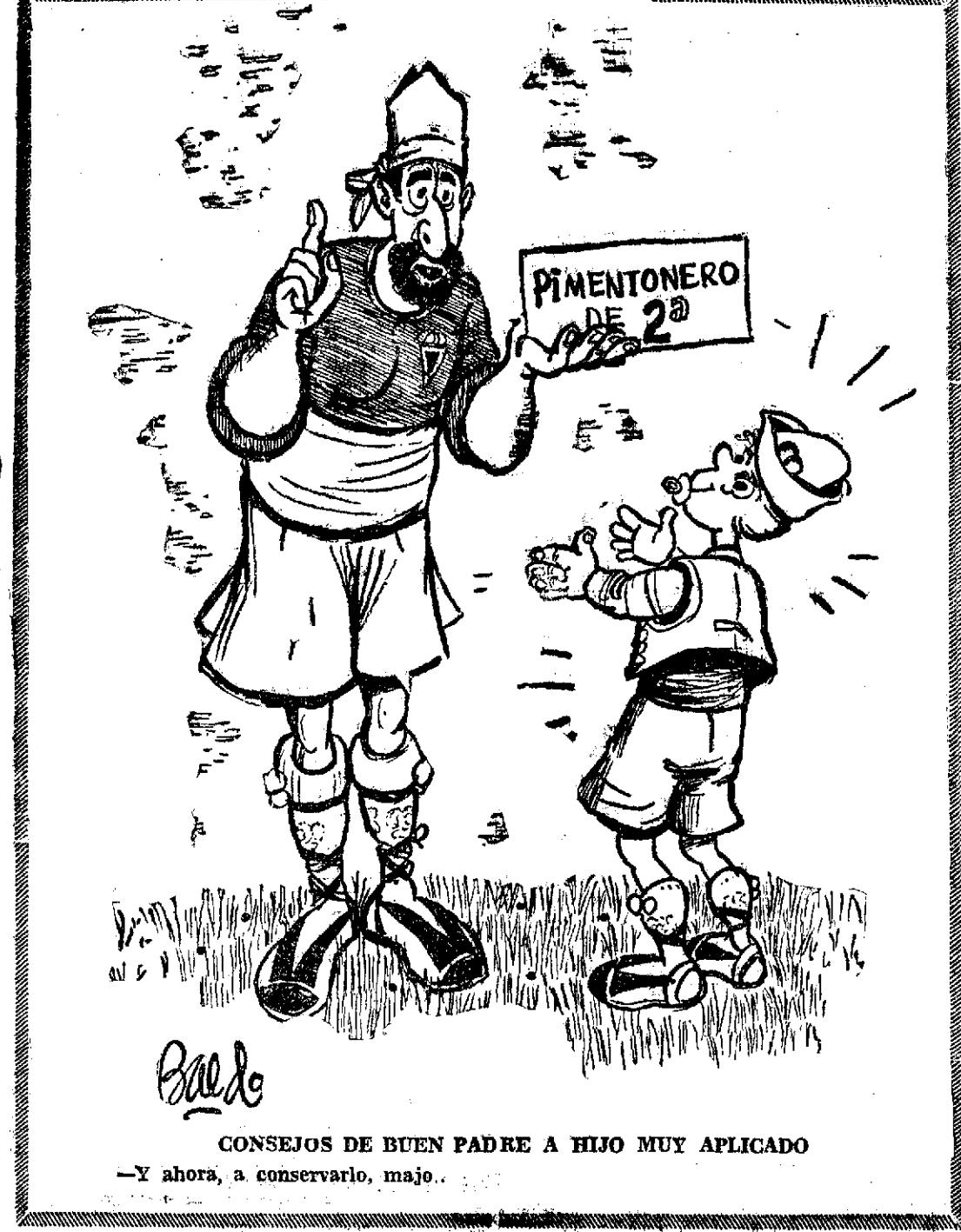
CONSEJOS DE BUEN PADRE A HIJO MUY APLICADO —Y ahora, a conservarlo, majo.