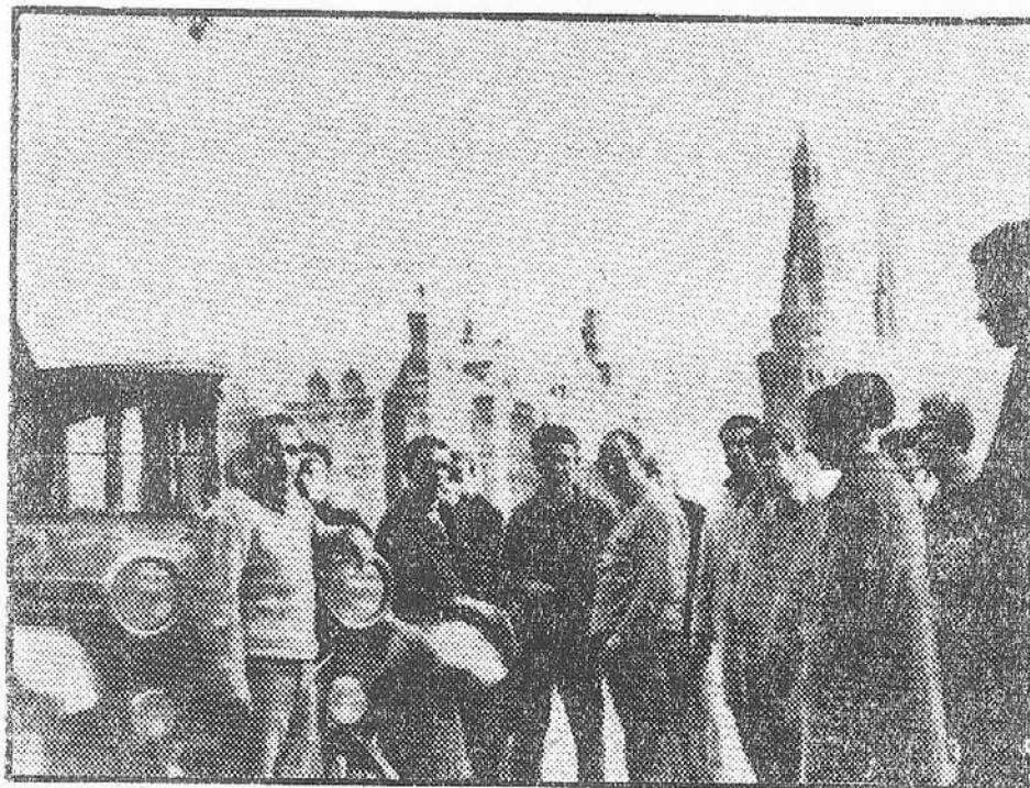
Cuatro amigos de Lloret de Mar han conseguido llegar desde su propia ciudad a Moscú con un "Rolls-Royce" de 1914. Con él posan ante el edificio del Kremlin. Hace unas semanas publicábamos en estas mismas páginas su foto, al salir de su pueblo.