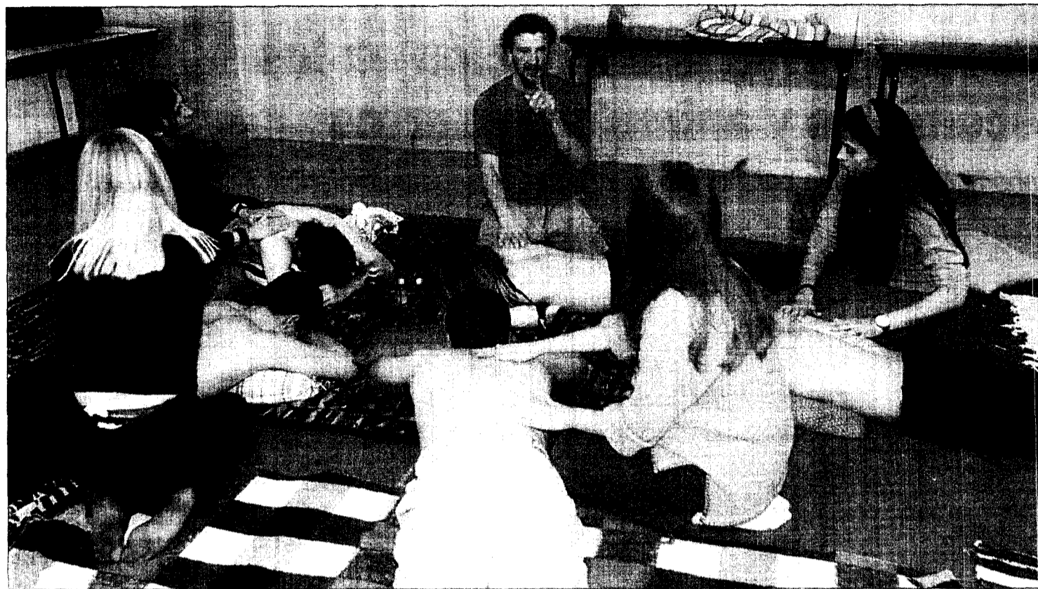
Varios jóvenes atienden las explicaciones para dar un buen masaje. La foto se tomó el viernes de madrugada en el centro Yesqueros.