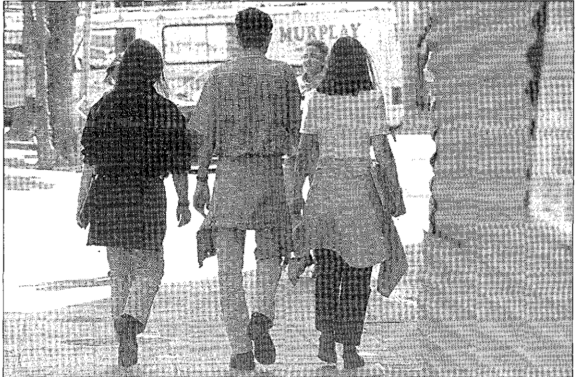
Un grupo de estudiantes universitarios en Murcia.