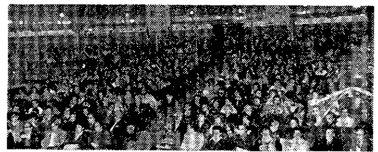
cincuenta años, puede ser una fecha particularmente propicia para reconocer lo que el nombre