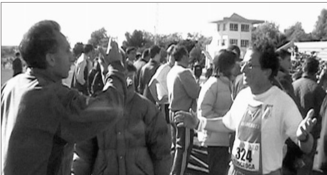
Tras el error de los jueces, los atletas mostraron su enfado con la organización. En la imagen, dos atletas.

tó con la colaboración de la Federación de Atletismo y la Concejalía de Juegos y Deportes.