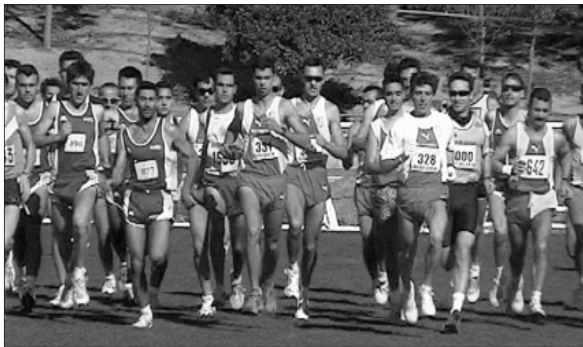
Momento de la salida de la prueba promesa y junior masculino, última en celebrarse.

La prueba celebrada en Lorca correspondía a la tercera jornada regional de cross y al mismo tiempo fue válida para designar a los clubes campeones de la región y que representaran a Murcia en los próximos Campeonatos de España. La organización corrió a cargo de la sección de atletismo de Eliocroca y con-