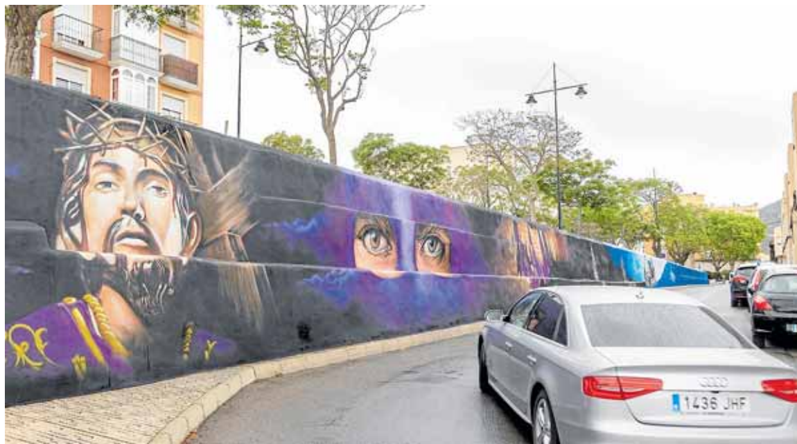
Un coche pasa frente a la imagen del titular marrajo, immortalizado en la calle Subida del Nazareno.

Entre esas alegorías a la mar se encuentra ese fondo marino en el que habita el marrajo, el tiburón mediterráneo que da nombre a la cofradía del Nazareno. También los peces que comunmente arriban al muelle de Santa Lucía como son el mero, el gallopedro o la llam-