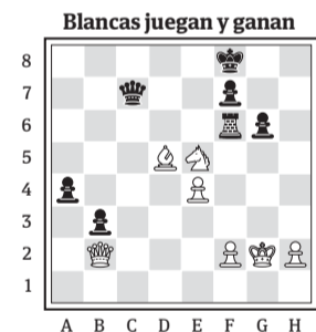
Partida: Cifuentes-Milos (Santiago de Chile, 1987).