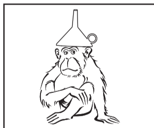
¿Qué es lo que te produce risa?