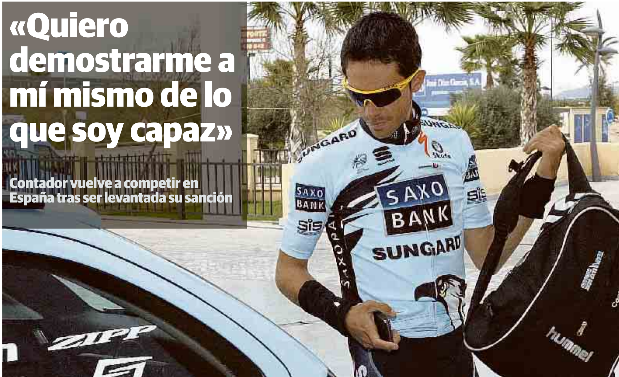
Alberto Contador, ayer en Los Alcázares antes de iniciar el entrenamiento con sus compañeros de equipo.

Contador vuelve a competir en España tras ser levantada su sanción