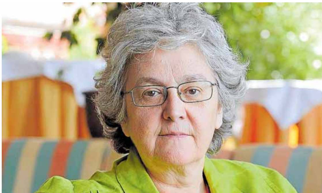
La periodista Soledad Gallego-Díaz, exdirectora de 'El País'.