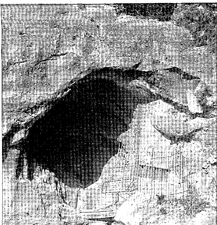
Imagen de la cueva del Barranco de los Grajos de Cieza.