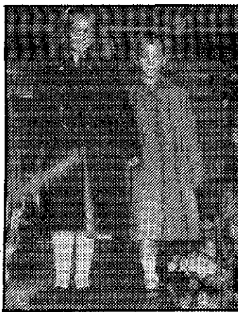
En marrón y azul marino, son deliciosos estos abriguitos de niña, de corte marinero.

A las 5 y a las 8'30 de la tarde del pasado domingo, Cerdán Hermanos presentó en el Hotel 7 Coronas Meliá su Gran Gala de la Moda Otoño/Invierno, viéndose sus salones