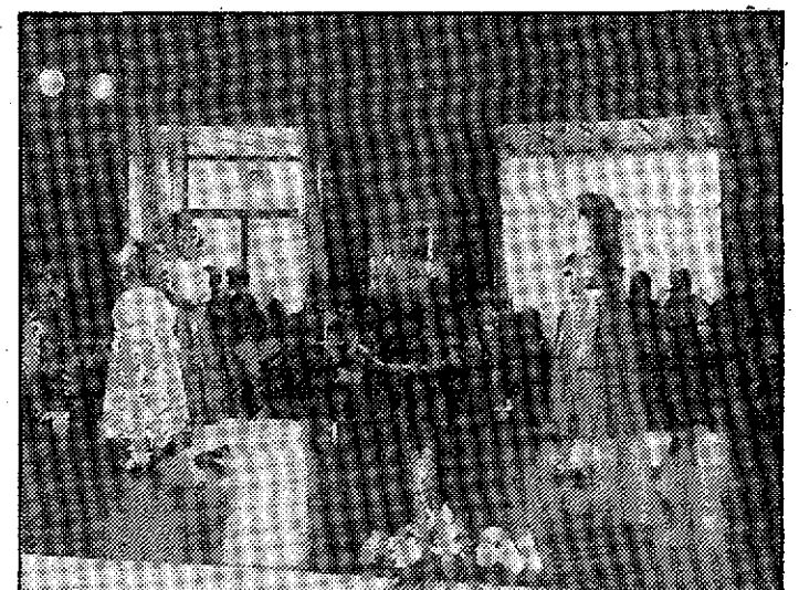
Estos vestiditos de fiesta para niña —y otros más que no aparecen en la fotografía— causaron verdadero impacto. Las niñas, con ellos, parecen «de dulce».