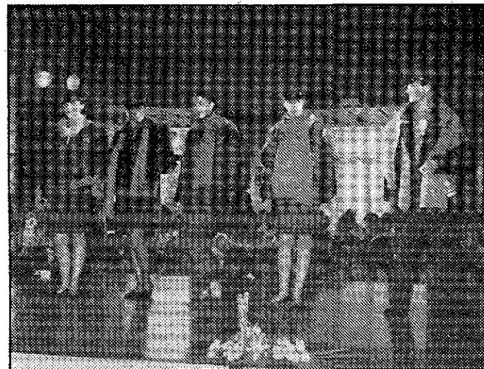
El cuadro es el verdadero protagonista del otoño. La gente joven los utilizará en todas sus versiones: escocés, madrás, ventana, harry, gales y Príncipe de Gales.