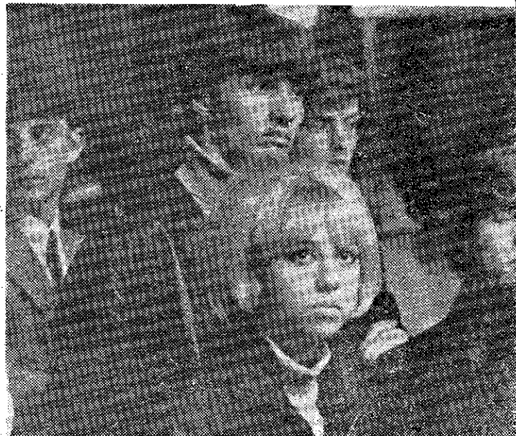
Los hijos de la estabilidad se aburren. No les basta tener aseguradas sus vidas hasta la tumba.

está traicionando a la vez es envidiable. Jamás las dificultades de tres generaciones más amplias. El suceso sobre este punto es absolutamente inusual. Hemos hablado