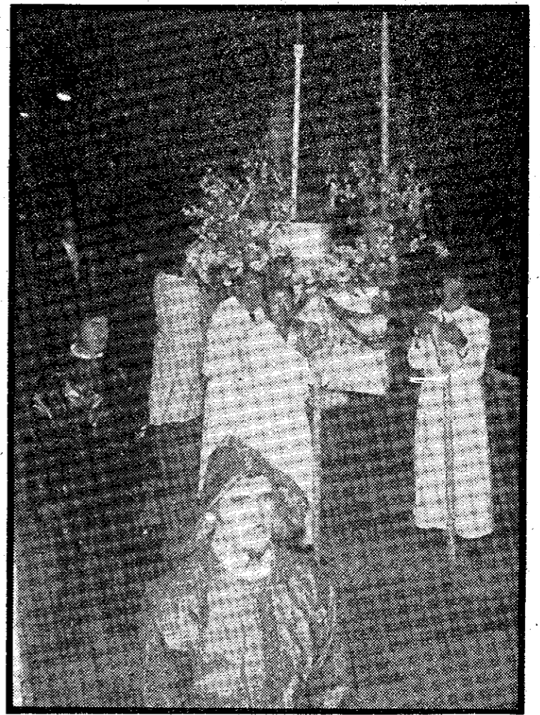
La imagen de "San Pedro en su barca de pescadores" rodeada de pescadores de Cabo de Palos (Cartagena).