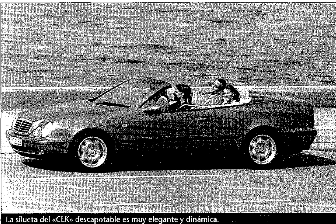
La silueta del «CLK» descapotable es muy elegante y dinámica.

La capota, que cuenta con accionamiento electrohidráulico, se oculta por completo en un alojamiento