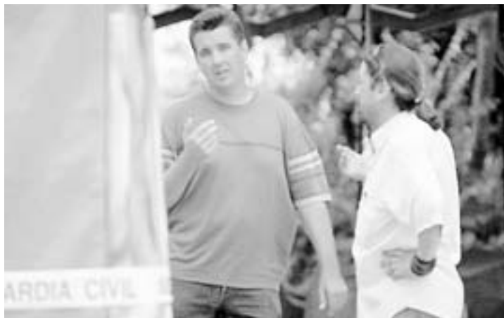
DECLARACIÓN. El dueño del 'Dragón' (izqda.) con un agente.

«No me enteré de nada hasta que escuche los gritos de la gente que estaba en el recinto ferial y entonces me dí cuenta de que algo había ocurrido con una niña»