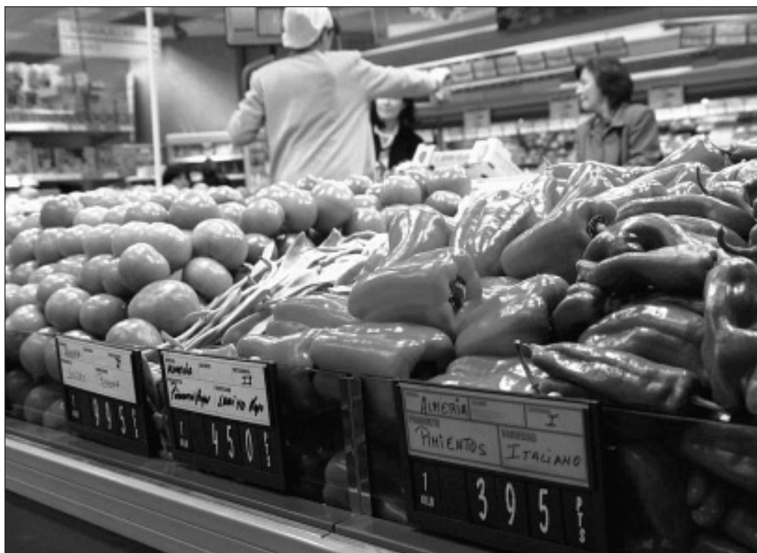
Cajas de pimientos en un expositor de un mercado. La foto es de archivo.

La poseidonia fue la que precisó menos gasto de agua. Los técnicos se sorprendieron de los resultados de los análisis realizados por la Universidad de Murcia, que demostraban un