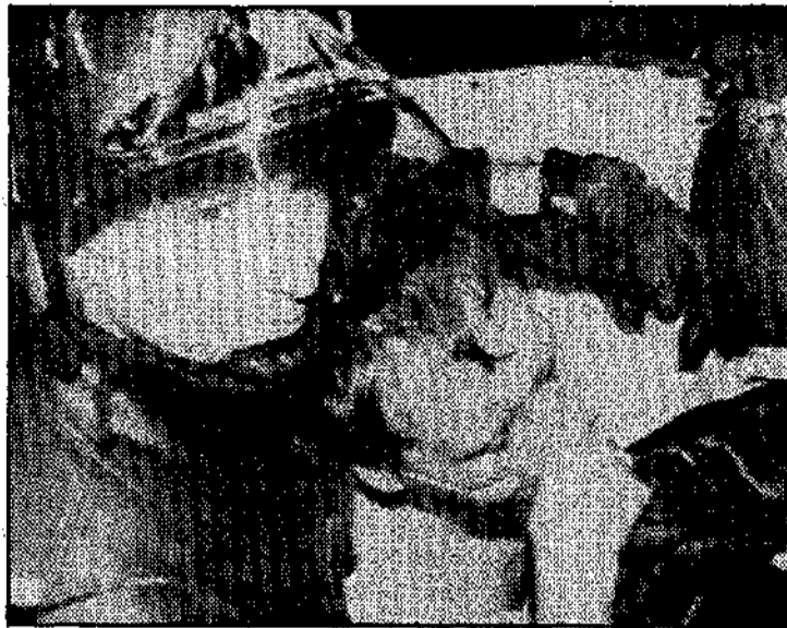
Un bombero rescata a uno de los heridos.