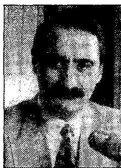
CARLOS HERRERA • Mañanas de 10 a 1 "LA MAÑANA"