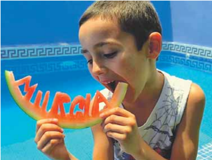
Fotografía premiada del colegio San Miguel de Molina.