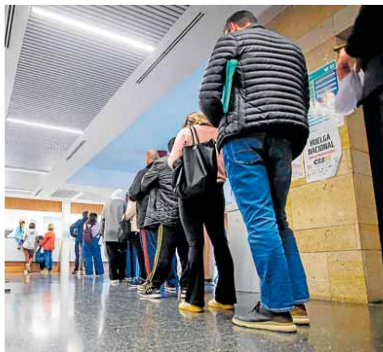
Pacientes aguardan a ser atendidos en un centro de salud.