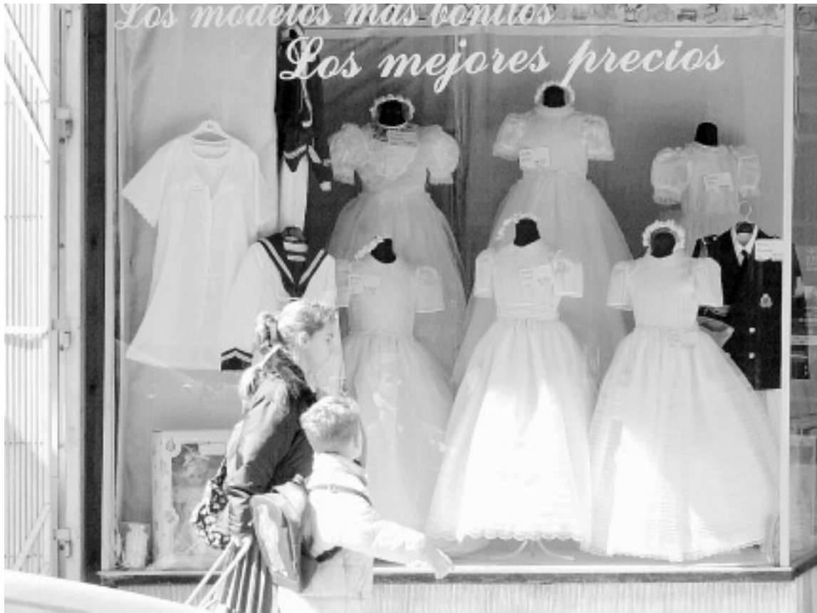
VARIEDAD. Unos niños pasan ante un escaparate repleto de trajes de comunión.

Una vez que las familias fijan el día comienzan los quebraderos de cabeza que, en algunos casos, se dejan sentir con un año de antelación si se quiere evitar el susto de no encontrar restaurante o vesti-