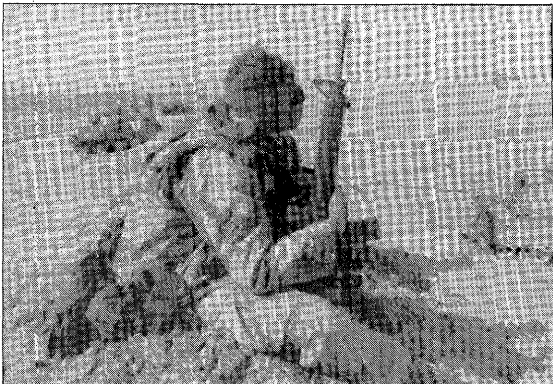
Los soldados aliados tuvieron menos resistencia de la anunciada por Irak.

15.— Irak acepta negociar las resoluciones de la ONU que piden su retirada de Kuwait, pero una vez más pone como condición que Israel se retire de los territorios árabes ocupados.