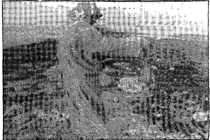
Los daños ecológicos son incalculables.

■ Una de las más graves secuelas de la guerra del Golfo será, sin duda, el desastre ecológico causado por el vertido deliberado de crudo al mar desde los pozos de Kuwait por parte de Irak, para dificultar el desembarco aliado. El incendio de pozos de petróleo causó también un desajuste atmosférico, con lluvias negras que alcanzaron Irán. En los últimos días de combates, los soldados iraquíes incendiaron casi 180 pozos de petróleo en Kuwait, una de las últimas imágenes de esta guerra.