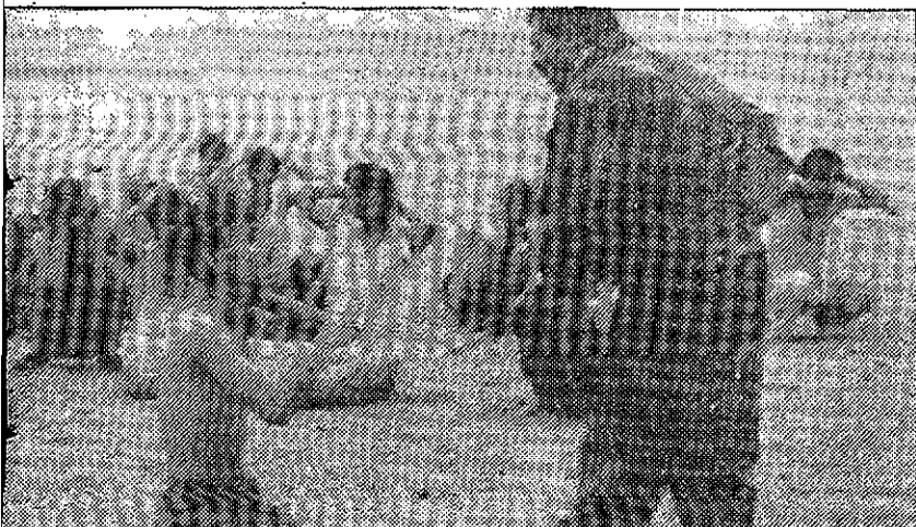
iones continuaban en las últimas horas.

28.— De madrugada, George Bush anuncia el alto el fuego, que entra en vigor a las 6 de la mañana. La guerra acaba.