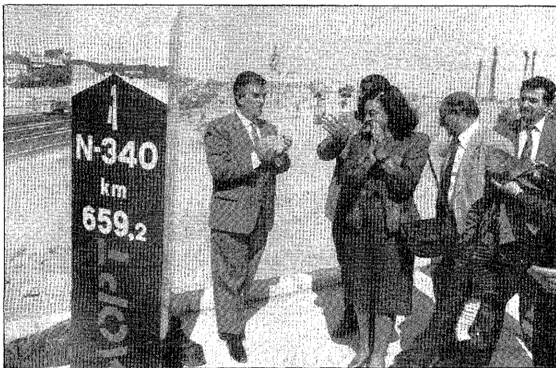
Los representantes de la Administración central aplauden tras la inauguración del tramo.

Por otra parte, José Javier Dombritz eludió comentar el contenido del próximo Plan de Infraestructuras en lo que afecta a la Comunidad Autónoma, y que el Ministerio