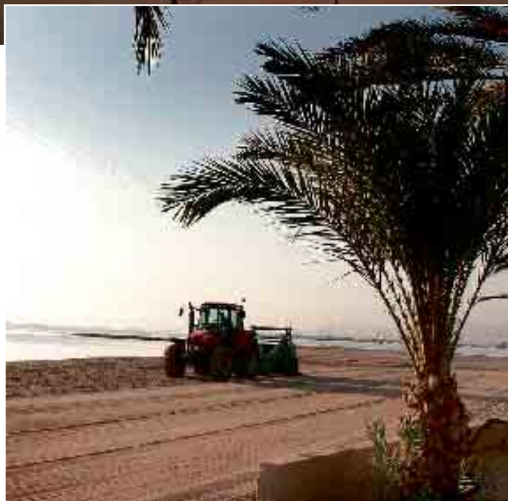
UN TRACTOR LIMPIA Y RASTRILLA LA ARENA DE LA PLAYA