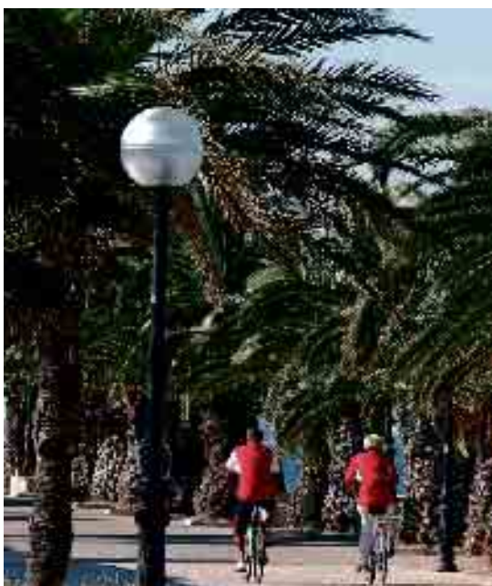
RESIDENTES EN BICICLETA EN EL PASEO MARÍTIMO