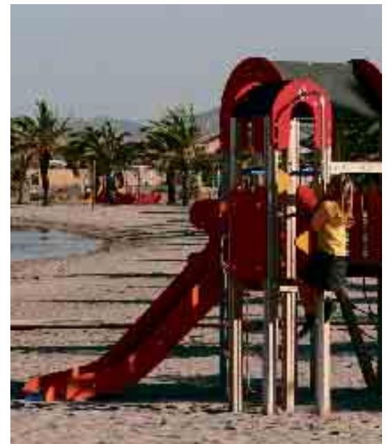
JUEGOS INFANTILES INSTALADOS EN LA PLAYA