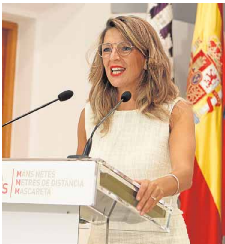
La ministra de Trabajo, Yolanda Díaz, ayer.

La propuesta de los empresarios –y donde los sindicatos también coinciden– es que a partir de ahora sean las compañías con más problemas, las que están cerradas y con ERTE total, las que reciban las mayores exoneraciones de las cuotas a la Seguridad Social que garantizan los ERTE por fuerza mayor para no ir a la quiebra. Es decir, que las empresas paguen menos cotizaciones por los trabajadores que no ha incorporado a la actividad que por los que sí, algo que el Gobierno se compromete a estudiar. En este sentido, el ministro de Inclusión y Seguridad Social, José Luis Escrivá, señaló que hay que ir valorando una situación que es «asimétrica» y seguir trabajando con los sectores que con-