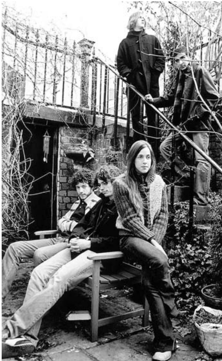
THE ZUTONS , un sonido que alinea el pop con el jazz, el soul, el funk y el country.

The Coral, The Zutons y The Stands logran que el pop británico vuelva a mirar a Liverpool. Son jóvenes, frescos y muy escuchados, Los dos primeros comparten cartel hoy en Barcelona