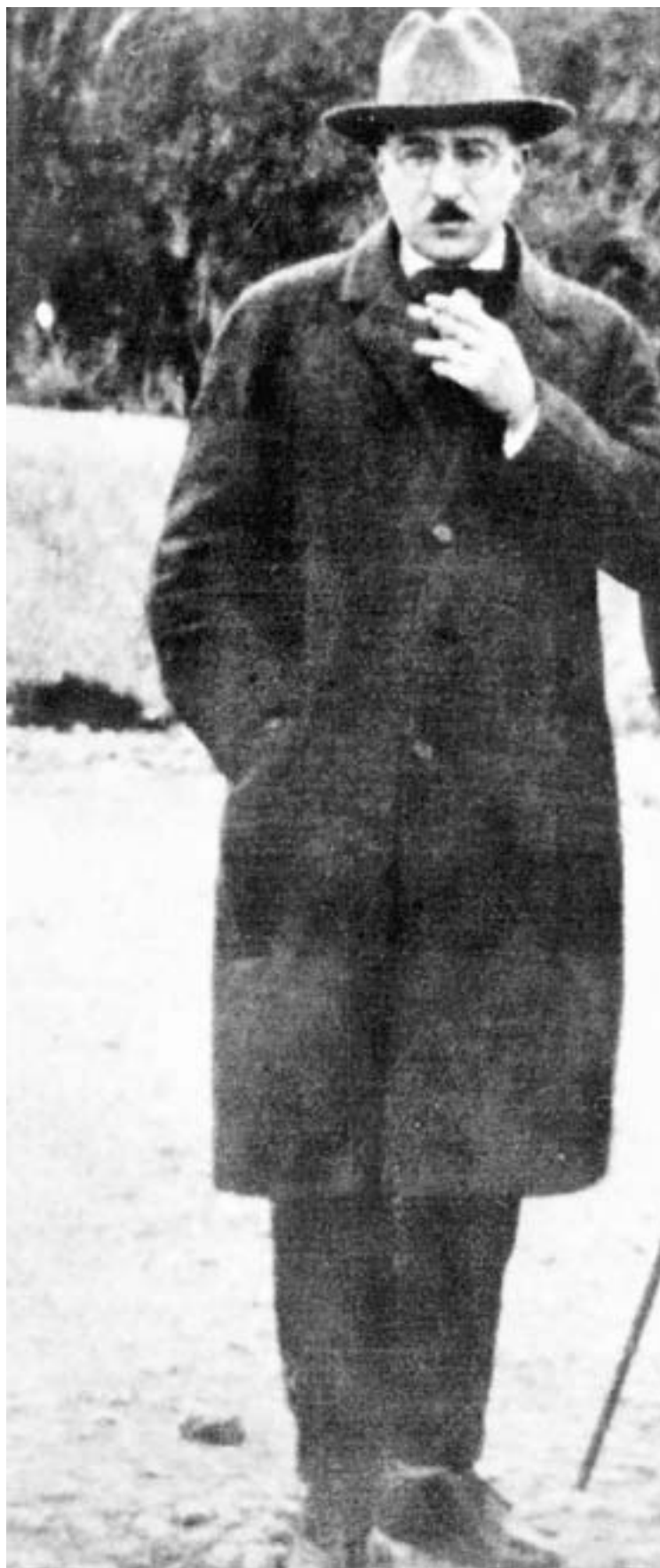
PROLÍFICO. El escritor portugués Fernando Pessoa.

capaz de defender distintas posiciones sobre el mismo tema y capaz de valorar a todos los creadores que en un principio habían sido relegados», precisa Vilagrassa. Ésta es una nueva forma de conocer a Pessoa, para quien la literatura estaba por encima de todo, y quien escribió ensayos literarios en revistas de vanguardia. Con-