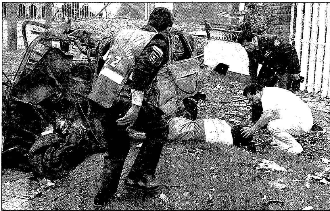
Un policía de Bogotá asiste a uno de los heridos por el coche bomba tras el atentado de ayer.