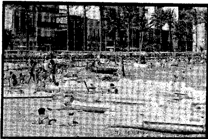
Aunque todavía no han llegado todos los turistas que se prevén, si han empezado ya los problemas por la falta de redes de saneamiento.