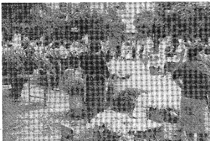
Las flores, producto de exportación.