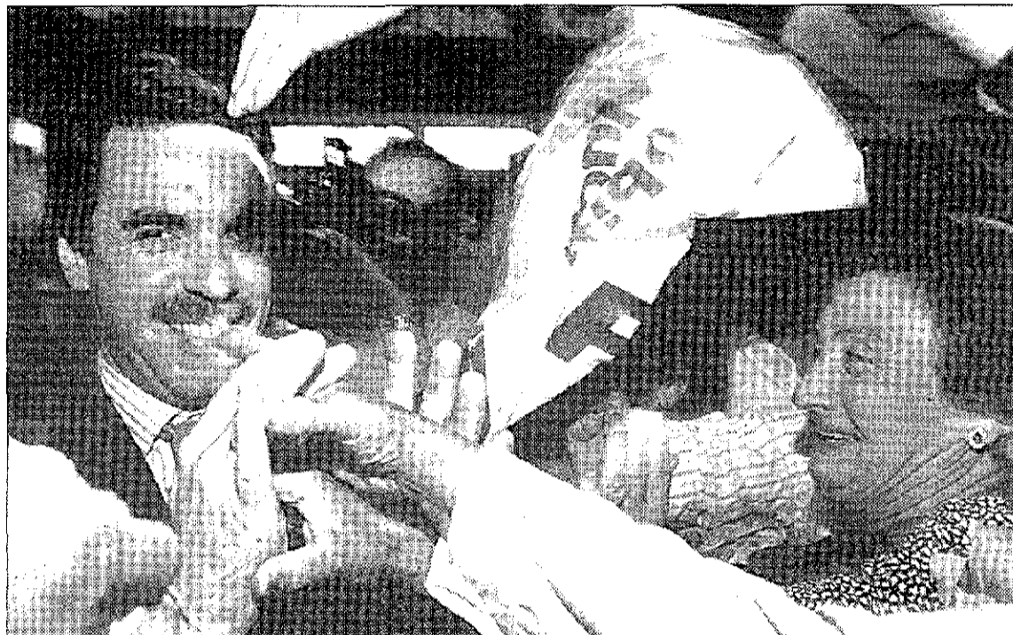
El PP ha intensificado su acoso al Partido Socialista.

El presidente popular no podrá evitar referirse a los asuntos de corrupción y los GAL durante la campaña electoral. «No es posible que pueda pasar sin hablar de los casos que están en los tribunales», asegura uno de sus asesores. Pero los estrategias de su dirección se afanan en la búsqueda de un discurso que les