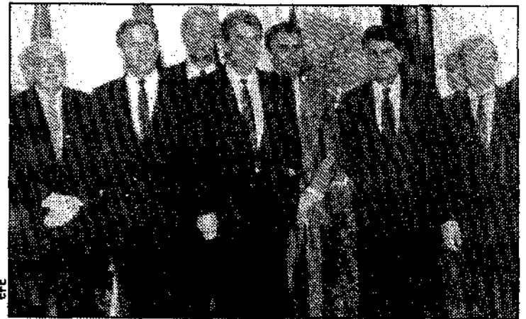
Felipe González, junto al presidente griego y varios primeros ministros comunitarios.

Por su parte, el presidente del Gobierno español, Felipe González, dijo que España defenderá la creación de un Banco Central Europeo, así como una política tendente al impulso social de Europa. A su llegada a la cumbre de Jefes de Estado y de Gobierno de la CE, Felipe González afirmó que «no hay fechas concretas» para la creación del Banco Central