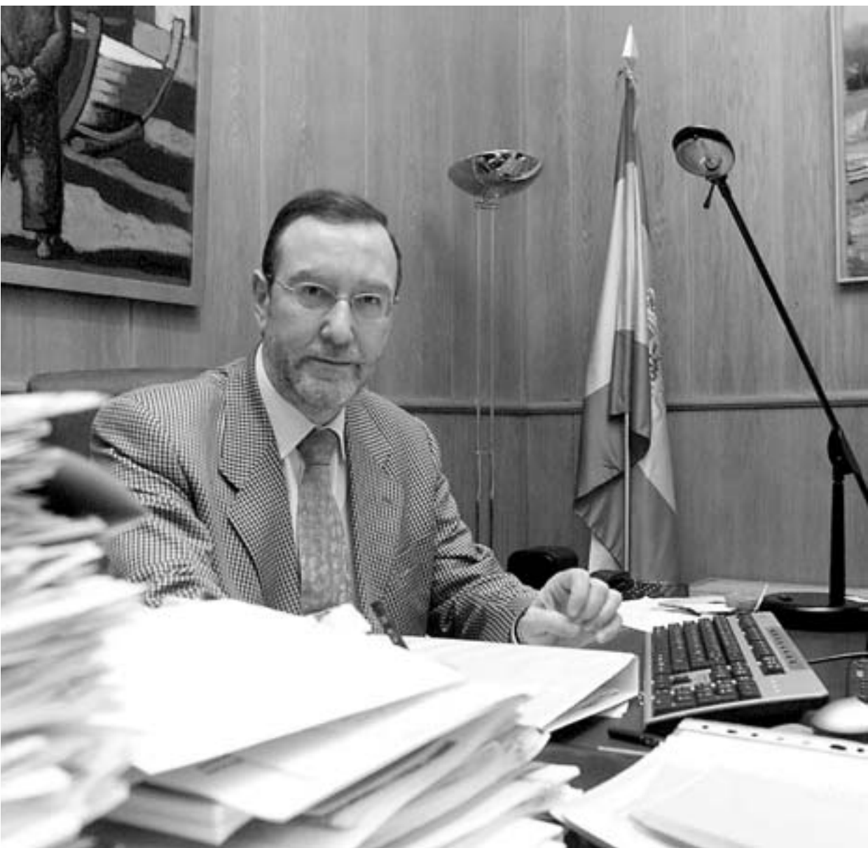
la entrevista realizada el pasado jueves en su despacho del Ministerio de Medio Ambiente.

El Hermano Mayor de la Vera Cruz de Caravaca deja su cargo el próximo domingo