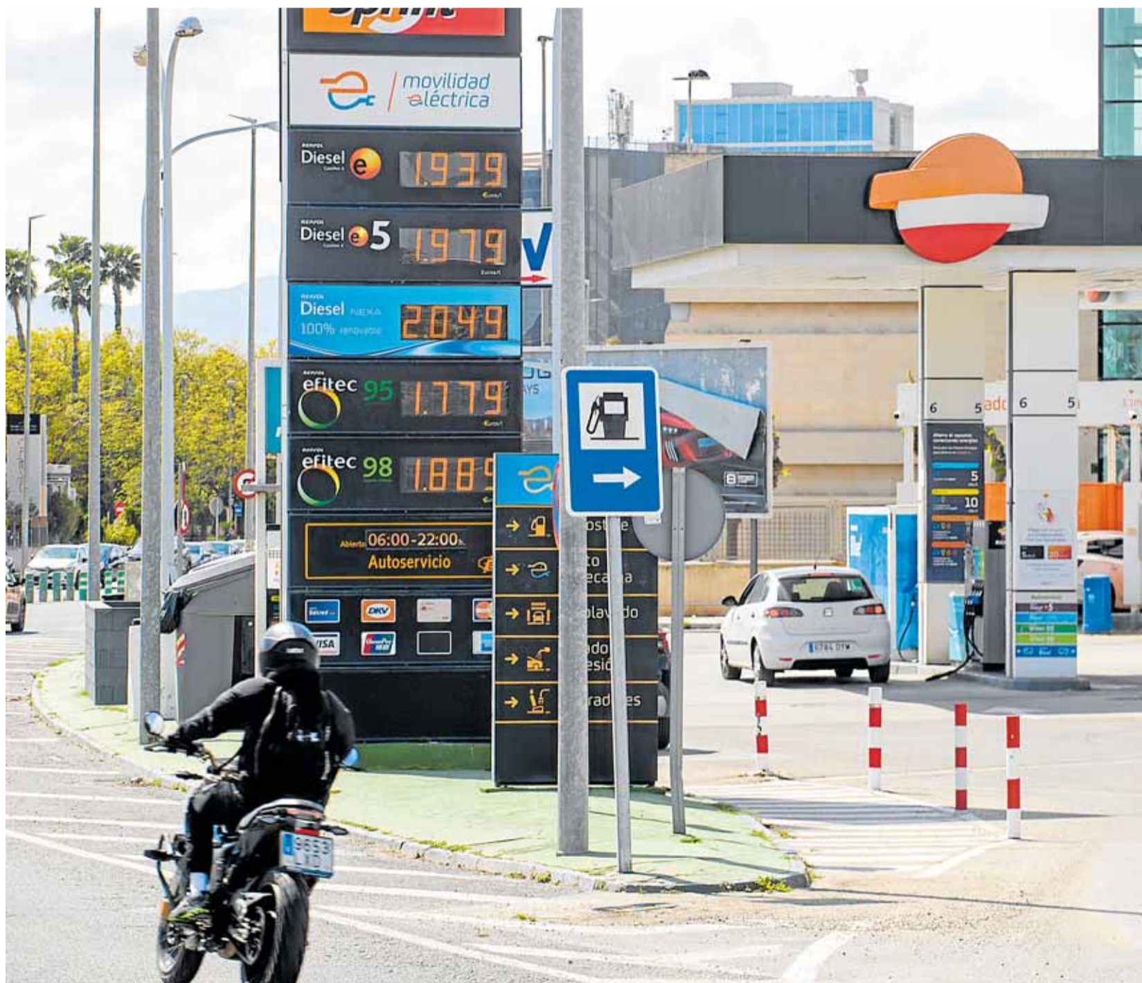
Listado de precios de los combustibles en una estación de servicio de Murcia, el pasado jueves.

Una de las medidas más destacadas es la bajada del 21% al 10% del IVA de gasóleo, gasolina y otros hidrocarburos, con el objetivo de frenar el golpe de la subida