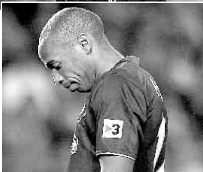
DESASTRE. Víctor Valdés y Henry, tras empatar el domingo con el Getafe.