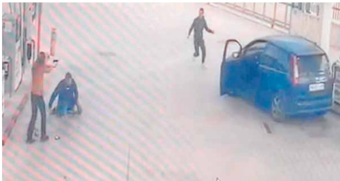
Una policía nacional apunta con su pistola a un hombre que apuñaló a su compañero en Murcia hace dos años.

Los datos del Instituto Nacional de Estadística reflejan esa evolución. En 2020 se contabilizaron 325 infracciones penales de este tipo en la Región. En 2021 fueron 402. En 2022, 425. En 2023, 505. Y en 2024, el último ejercicio cerrado, la cifra alcanzó los 620 casos. En apenas un lustro, el volumen de delitos prácticamente se ha duplicado, sin que ningún año haya marcado un punto de inflexión a la baja. Y si no se produce