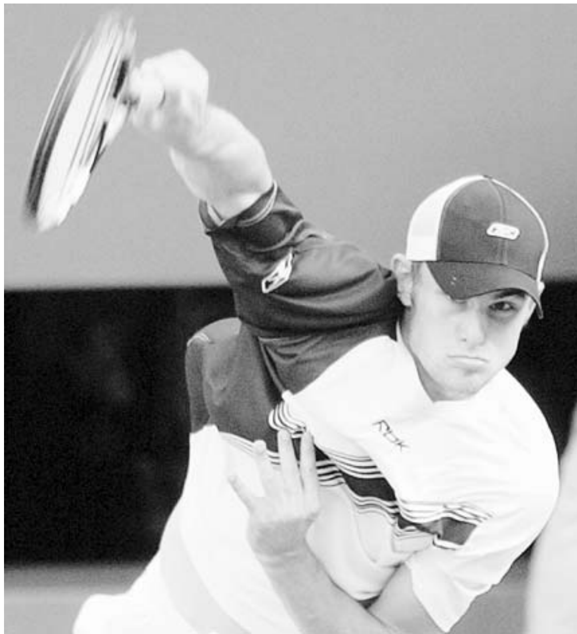
DEMOLEDOR. Roddick saca en su partido de ayer ante Juan Carlos Ferrero.