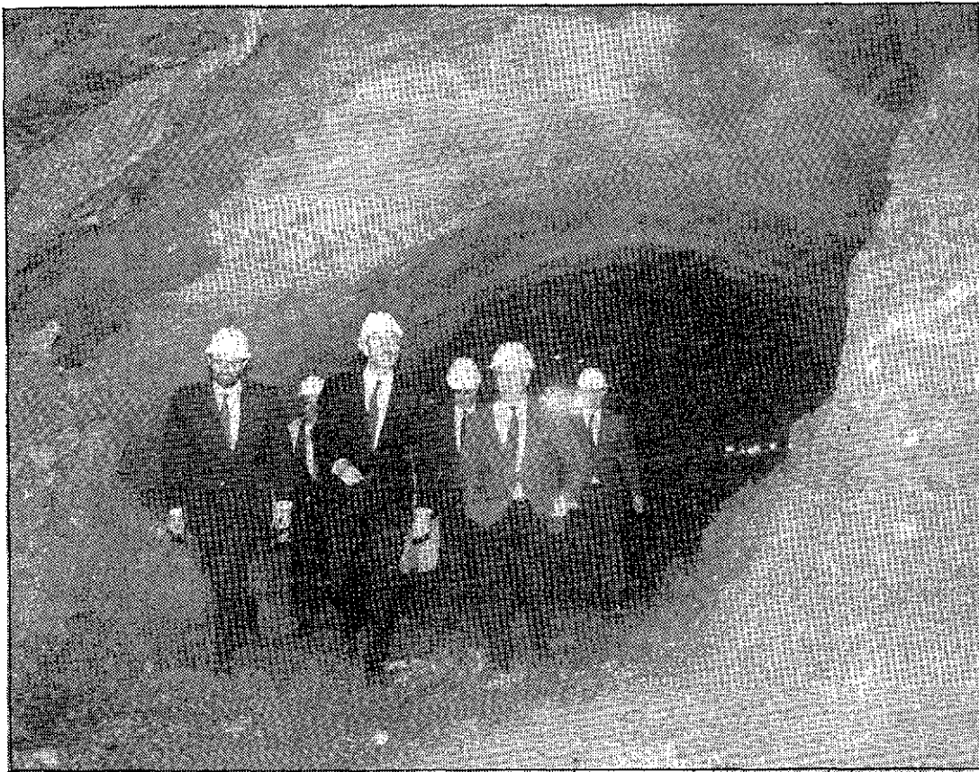
El secretario de Infraestructuras y los técnicos atraviesan el nuevo túnel.