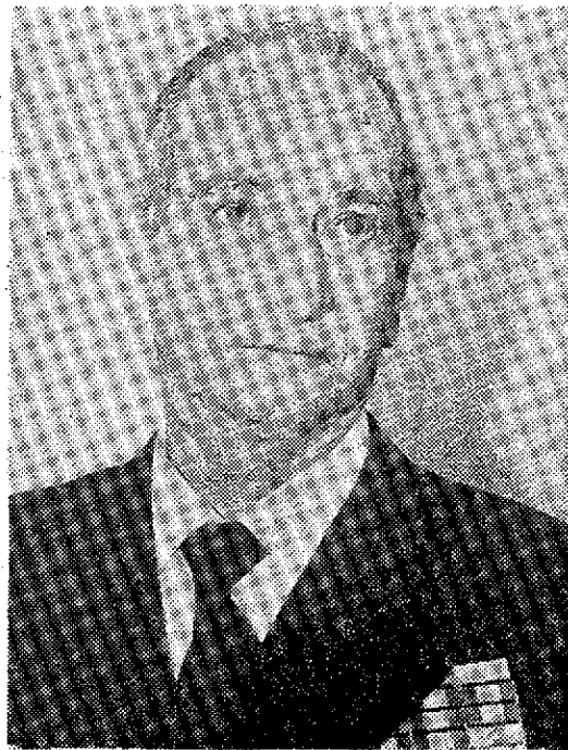
Almirante Suanzes de la Hidalga, jefe del Estado Mayor de la Armada.

actual de nuestra Marina, respondió que "en el aspecto material, se halla con gran ilusión. Se está construyendo y se va a construir más todavía, lo que es, sin duda, importante para la Marina, para la industria naval y para España".