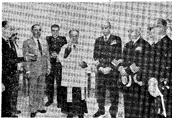
El teniente vicario de la Zona Marítima bendice el Archivo Histórico de la Armada.—(Foto PEDRO SAGA)