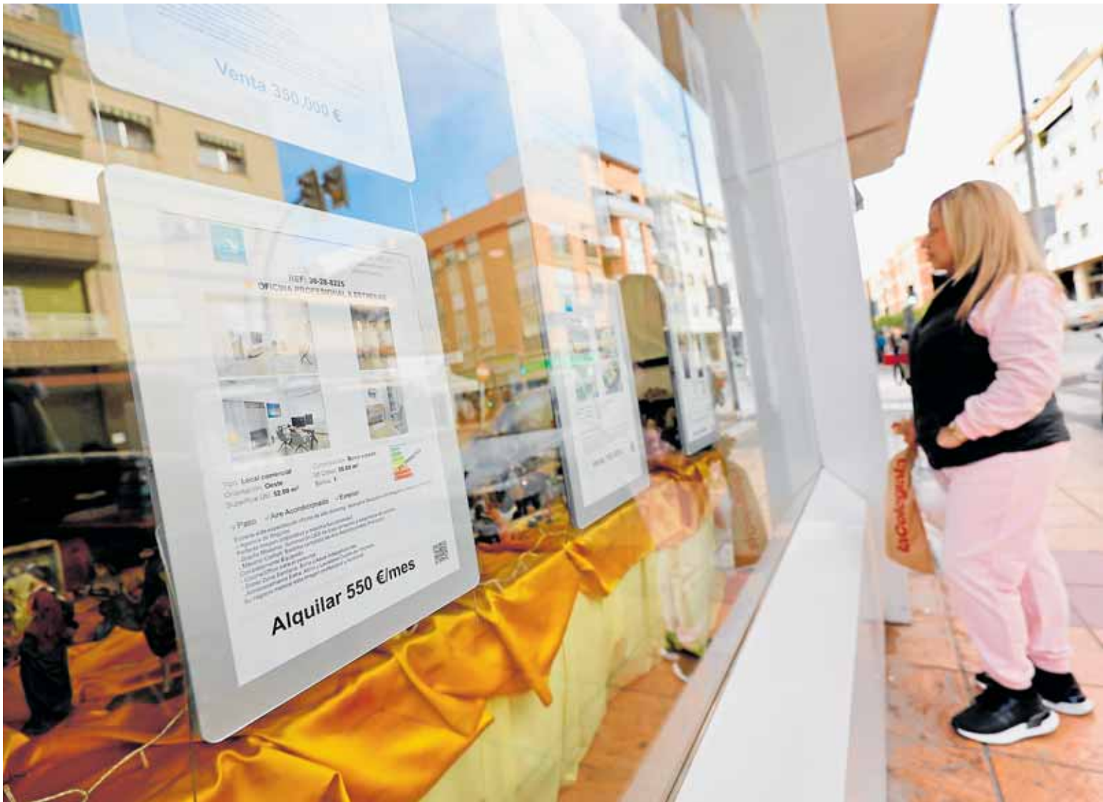
Una mujer consulta las ofertas en una inmobiliaria de la ciudad de Murcia. NACHO GARCÍA

Precisamente esta es la advertencia que ha lanzado el Ministerio de Derechos Sociales, Consumo y Agenda 2030, liderado por Pablo Bustinduy, en lo que se está dando a conocer como 'la gran revisión'. Según un informe elaborado por esta entidad y recogido por Europa Press, con datos extraídos del Panel de Hogares elaborado por la Agencia Tributaria en colaboración con el INE y el Instituto de Estudios Fiscales, la extinción de esos contratos de alquiler va a afectar a casi 43.000 personas en la Re-