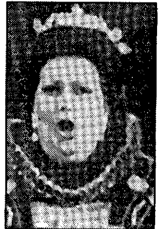
ALV Monserrat Caballé será una de las figuras que aparezca en el programa.

«No pretendemos —continúa— que la ópera guste a todo el mundo. El programa está dirigido a aquellas personas que desconocen este género lírico». Las explicaciones irán acompañadas por posteriores fragmentos de óperas cuyos protagonistas será la figura invitada en esa semana. Estos fragmentos más populares se emitirán en directo con traducción de los textos a través de subtítulos.