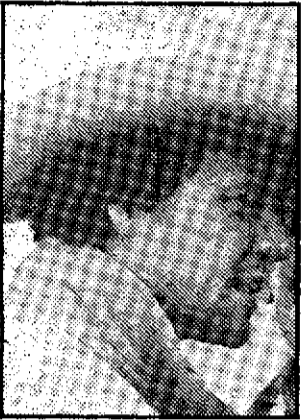
David Soul, uno de los protagonistas de «La rosa amarilla», que termina esta tarde.