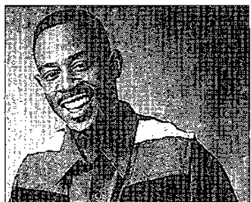
El cómico Martin Lawrence protagoniza la serie 'Martin'. 20.05 horas.