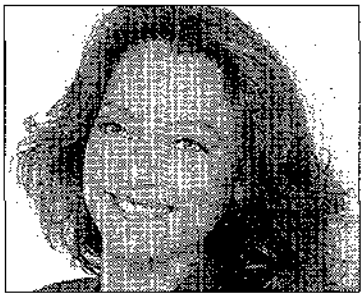
Sonsoles Suárez presenta el informativo 'A toda página'. 20.10 horas.