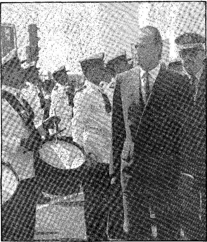
Don Juan Carlos pasó revista a las tropas que le rindieron honores.