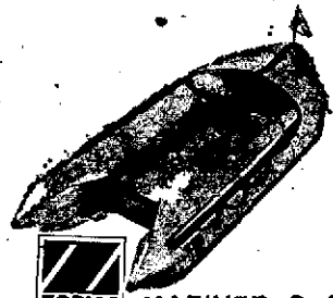
ZODIAC MARINER 2 CV