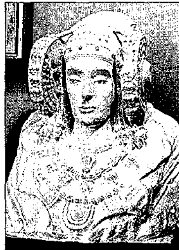
La Dama de Elche.

Sobre el polémico traslado del busto, el realizador ilicitano opina que «nació, vivió, fue enterrada y descubierta en Elche y lo lógico es que estuviera allí». Herranz se pregunta: «¿Qué es lo que ha pasado para que los sólo cincuenta y tantos años que lleva en España, hayan sido peores para la Dama