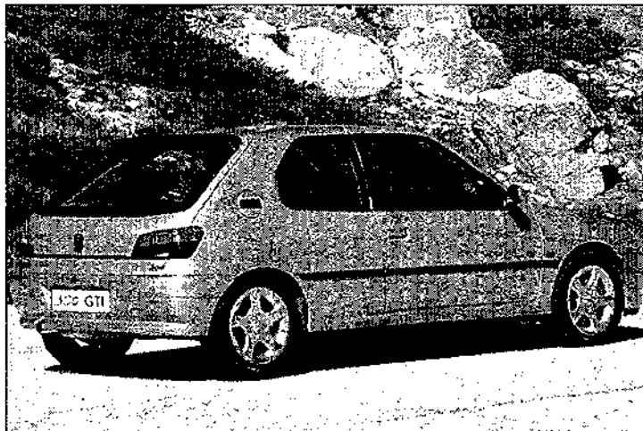
A pesar de sus prestaciones, el aspecto es bastante discreto.

El «306 GTI» dispone de uno de los grupos motrices más potentes de su clase. Se trata de un motor atmosférico de 2.0 litros de cilindrada, con doble árbol de levas y 16 válvulas, desarrollado a partir de los motores que montaba el anterior S16. La potencia máxima es de 167 CV a 6.500 r.p.m., ofreciendo el par máximo (193 Nm) a 5.500 r.p.m. Para aprovechar todo el potencial de este propulsor, se la ha acoplado una caja de seis relaciones con la que logran unas excelentes prestaciones, con un 0 a 100 Km/h de sólo 8,8 segundos y 29,9 segundos para recorrer un kilómetro con salida parada. El consumo homologado es razonable mientras se circula a velocidades legales. Buena prueba de ello es la cifra de 9,4 litros a los 100 kilómetros en consumo combinado homologada según la nueva normativa europea, con un consumo en carretera de 7,1 litros/100 Km y en ciudad de 13,6 litros. Las cifras se elevan de forma considerable, cuando se circula a velocidades elevadas, cosa realmente fácil dada la tre-