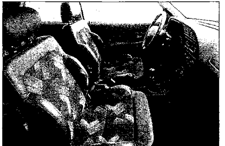
Los asientos delanteros sujetan muy bien el cuerpo.