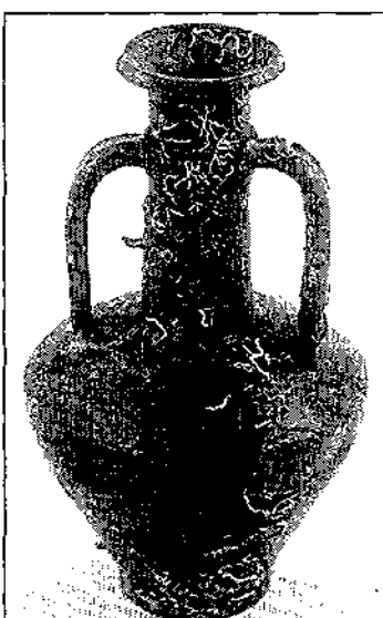
Una de las piezas halladas.

El más antiguo de los barcos, bautizado Skerky Delta navegaba entre el final del Siglo II o a principios del I a.C. y sería, según los investigadores, uno de los más raros y más antiguos de la época romana descubiertos hasta la fecha. «Es un gran navío de comercio dotado con tres velas y de más de 30 metros de largo», señaló la